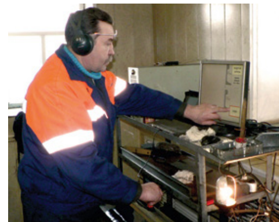
Работа на рельсосварочных предприятиях