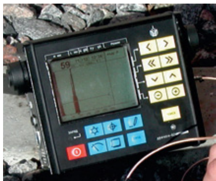
Представление сигналов: А- и В- развертки, "Огибающая", "Стоп-кадр"

Идеальный дефектоскоп для контроля отдельных сечений рельсов в пути, контроля металлоизделий и сварных соединений в полевых и стационарных условиях