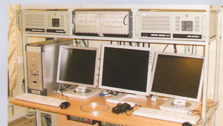
Рис. 2. Дефектоскопический комплекс АВИКОН-03М