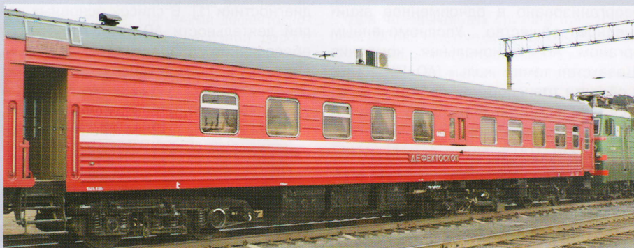
Рис. 1. Вид совмещенного вагона-дефектоскопа СВД-491

платации и обслуживанию дефектоскопического комплекса АВИКОН-03М, вагонного оборудования, а также по расшифровке дефектоскопической информации, принимаемой с регистрирующих устройств совмещенного вагона-дефектоскопа. На трехнедельных курсах по подготовке расшифровщиков дефектограмм объяснялись принципы формирования сигналов от возможных дефектов и помех на развертке типа В, анализ информации в каналах магнитного и визуального контроля, порядок расшифровки дефектограмм и выдачи заключения о качестве проконтролированного участка пути. Одновременно представители Казахстанских железных дорог имели возможность обмениваться опытом с российскими коллегами, которые достаточно долго занимаются расшифровкой дефекто-